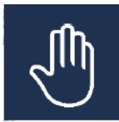
Luttes contre la corruption

« Chez VERPACK , nous pensons la RSE comme une ressource d'intérêt général. Convaincu de la nécessité du Développement Durable pour le bien commun, convaincu de la pertinence d'une approche territorialisée pour la diffusion des Objectifs de Développement Durables, notre participation active au Global Compact s'impose à nous comme un axiome. »