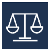
Normes du Travail